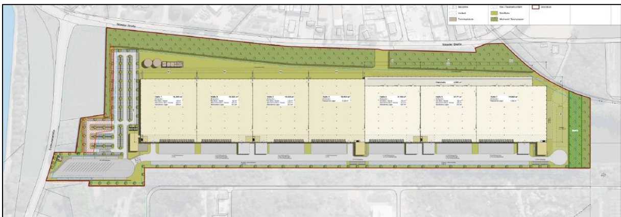
Entwurfskonzept (Vorentwurf) des geplanten Logistikparks (greenfield development GmbH)