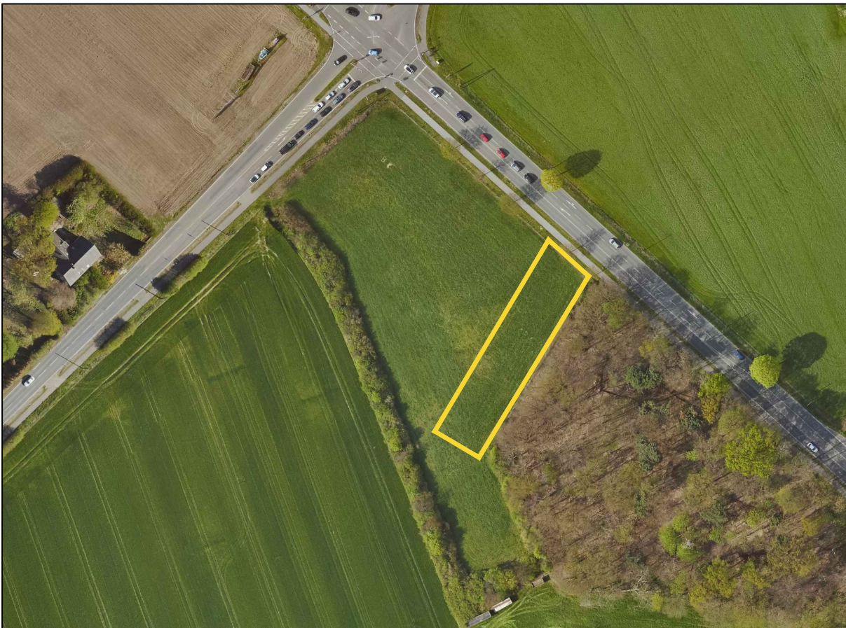
Luftbild Frühjahr 2019